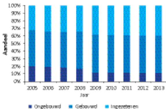
Figuur 1 Aandeel belastingcategorieën in opbrengst waterschapsheffingen

In de meeste waterschappen betaalde ongebouwd echter wel degelijk een kleiner aandeel. Dit is af te leiden uit de kostenaandelen op macroniveau. In figuur 1 is op basis van CBS-gegevens weergegeven welk deel van de belastingen afkomstig is van ingezetenen, gebouwd en ongebouwd. 7 De Wet modernisering waterschapsbestel werd in 2008 van kracht. Vanaf 2009 zijn belastingen geheven op basis van de nieuwe wetgeving. In 2008 was het kostenaandeel van ongebouwd nog 17%. In 2009 is dit gedaald naar 12%. 8